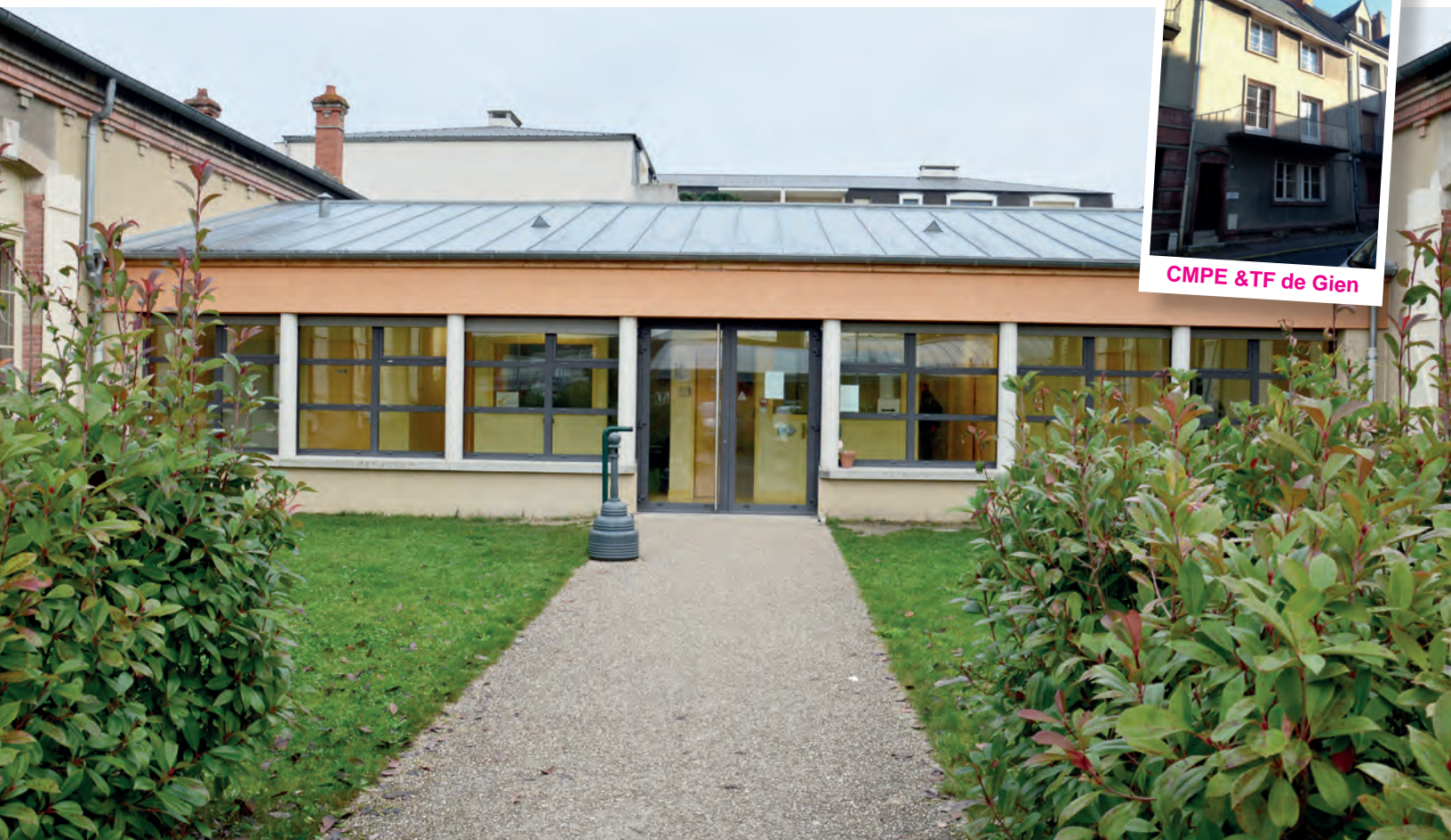
CMPE & TF de Gien

Le service de Pédopsychiatrie est rattaché au Centre Hospitalier de l'Agglomération Montargoise et dépend du Pôle URIAL-PSY-SCPT :