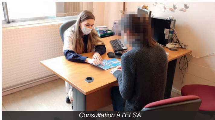
Consultation à l'ELSA