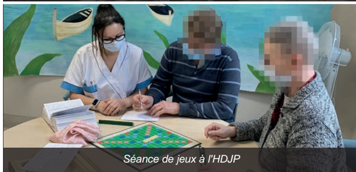
Séance de jeux à l'HDJP