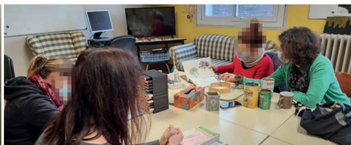
Atelier créatif au CATT