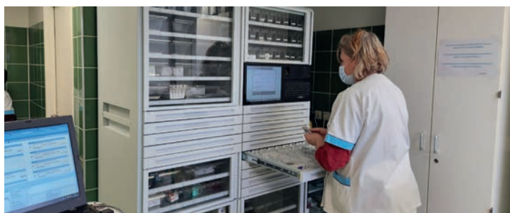
L'armoire à pharmacie sécurisée au sein de l'unité 1 de l'UHP