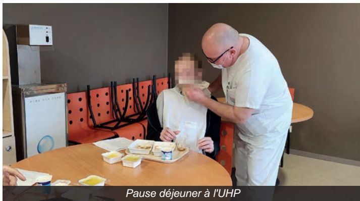
Pause déjeuner à l'UHP