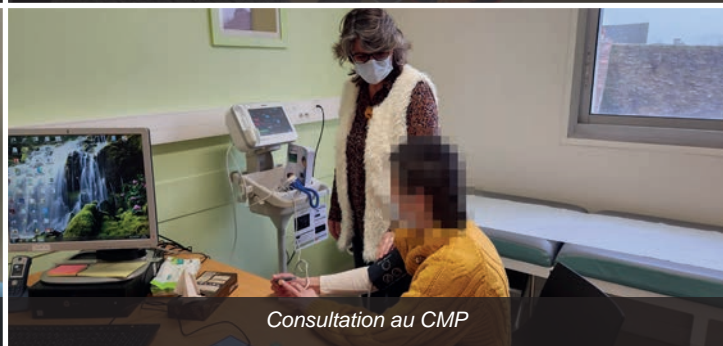
Consultation au CMP

La psychiatrie adulte du Centre Hospitalier de l'Agglomération Montargoise (CHAM) est composée de plusieurs structures intra et extra-hospitalières.